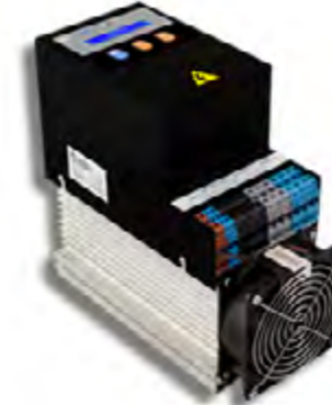
C-SVC 30 ...50