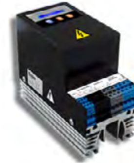
C-SVC 5 ...20

Solar Enerji Üretim Santrallerinde Kapasitif Cezaya Son !!!